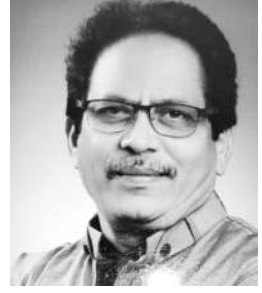
విష్ణు వర్ధన్ రాజు