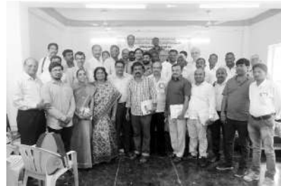
ముల్కనూర్ - నమస్తే తెలంగాణ కథల పోటీలు 2019, 2020 బహుమతుల పంపిణీ కార్యక్రమాల్లో విజేతలు, ప్రముఖులు